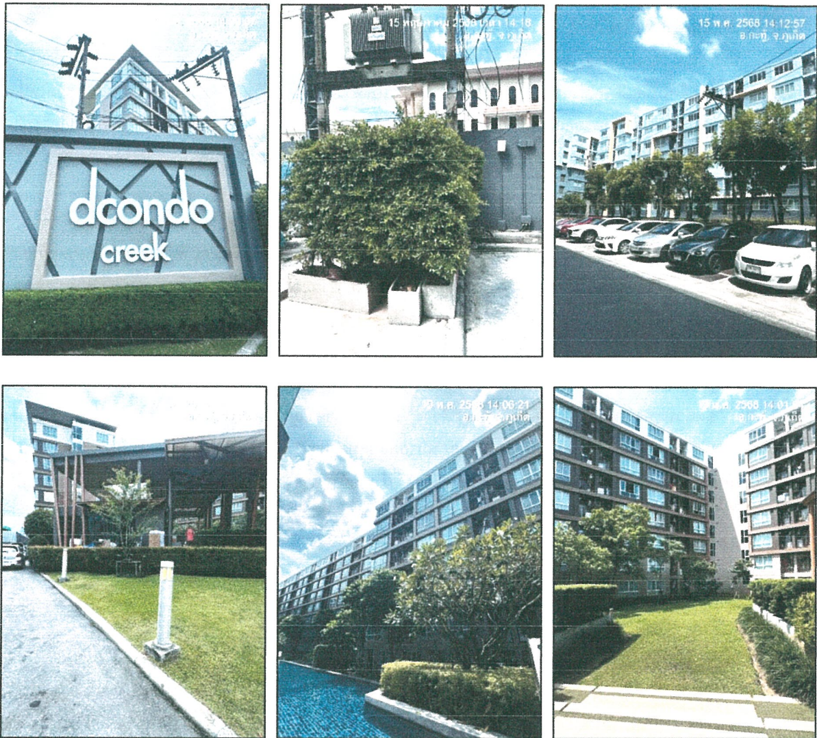
รูปภาพที่ 1.4 การใช้พื้นที่อาคาร